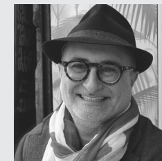
Una filosofia de la identitat Joan-Carles Mèlich

Dimarts 26 de febrer, a les 19h Escola Frederic Mistral-Tècnic Eulàlia (Sarrià)